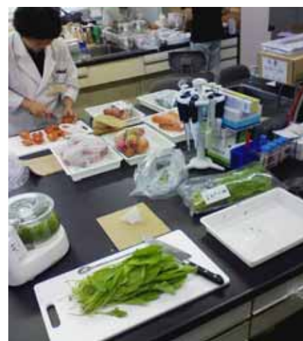
写真1 県内産農産物の均一化処理

検査は、農協、道の駅などの産地直売所、食品スーパーなどの小売店で販売されているものや、食品製造工場等で使われる輸入加工食品を、保健所や食品安全監視センターの食品衛生監視員が選定したものについて行っています。