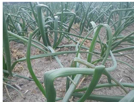
図2 タマネギべと病の多発ほ場