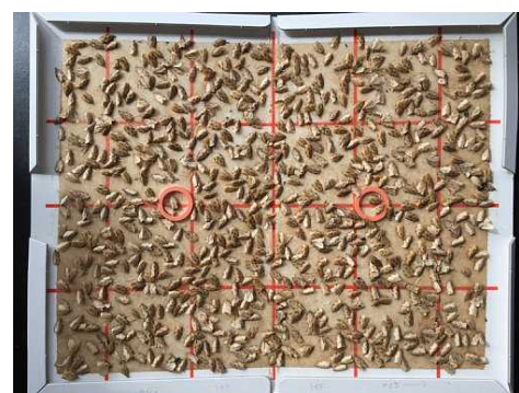
写真 フェロモントラップへのチャノコカクモンハマキ成虫の誘殺状況 (4/22撮影)