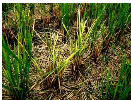
図1. イネ縞葉枯病が発生した 刈株再生芽

イネ縞葉枯病ウイルスを保毒したヒメトビウンカは、越冬後に本田に飛来し、イネを吸汁加害してウイルスを感染させます。このため、昨年秋に刈株再生芽でイネ縞葉枯病の発生が目立ったほ場・地域では、ヒメトビウンカに効果のある育苗箱施薬を施用して、イネ縞葉枯病の発生を防ぎましょう。