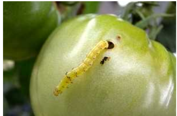
トマトの果実へ食入加害