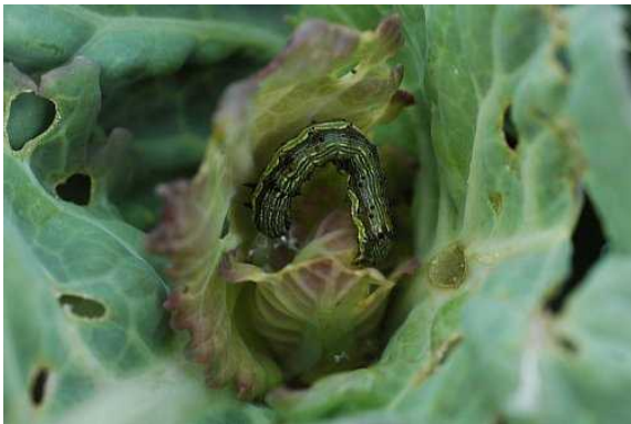
キャベツの芯部を加害