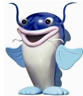
マスコットキャラクター 「ピナちゃん」

また、びわこボートレース場では競艇事業以外に、ファミリーカーニバルの開催や、びわ湖ドラゴンボートスプリント選手権大会の会場として施設を開放するなど、施設の紹介や競艇事業のPRに努めています。