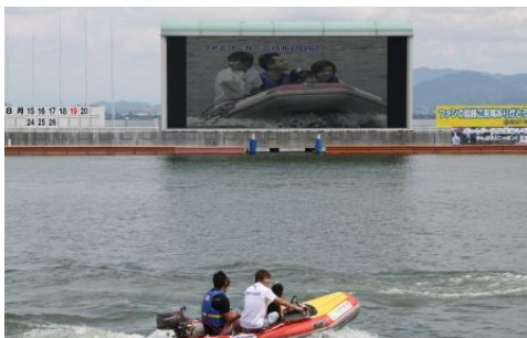
ファミリーカーニバル 平成24年8月12日（日）