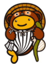
信楽焼たぬきクーちゃん (滋賀県のご当地クーちゃん)

そうしたお金が道路や橋、学校、公園の整備など県内の公共事業に使われて、みんなの豊かな生活のためにたいへん役立っているんだ。