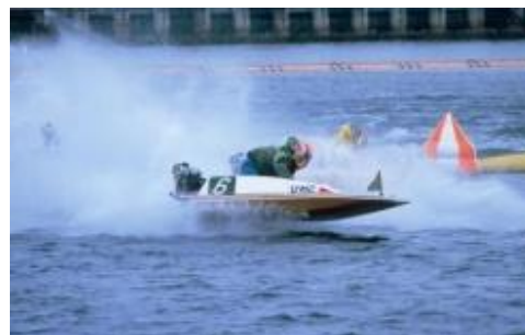
迫力のボートレース