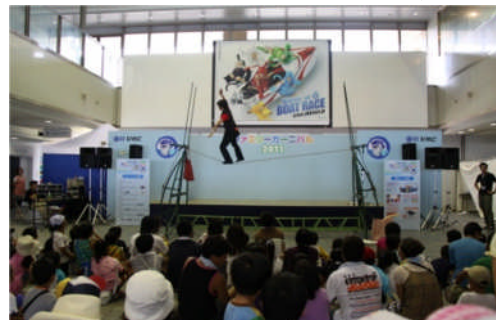
ファミリーカーニバル 平成23年7月31日（日）