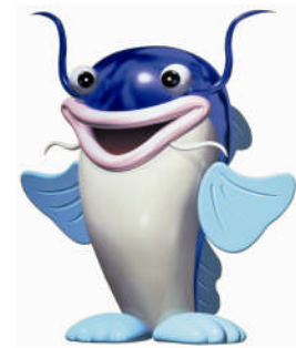
マスコットキャラクター 「ピナちゃん」

また、びわこボートレース場では競艇事業以外に、ファミリーカーニバルの開催や、びわ湖ドラゴンボートスプリント選手権大会の会場として施設を開放するなど、施設の紹介や競艇事業のPRに努めています。