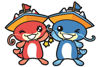
マスコットキャラクター 「ピーナスちゃん」「ピナちゃん」

また、びわこボートレース場ではボートレース以外に、ファミリーカーニバルの開催や、スモールドラゴンボート日本選手権大会の会場として施設を開放するなど、施設の紹介やボートレースのPRに努めています。