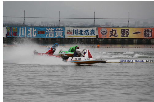
迫力のボートレース