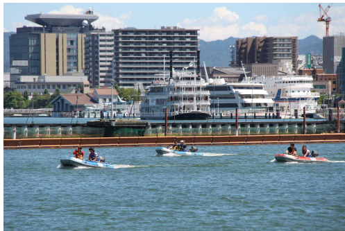
ファミリーカーニバル 平成30年7月22日（日）