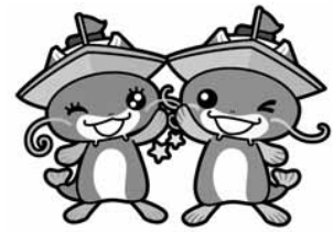
マスコットキャラクター 「ピーナスちゃん」「ピナちゃん」

また、びわこボートレース場では競艇事業以外に、ファミリーカーニバルの開催や、スモールドラゴンボート日本選手権大会の会場として施設を開放するなど、施設の紹介や競艇事業のPRに努めています。