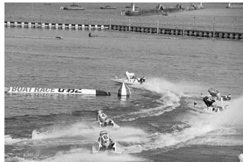
迫力のボートレース