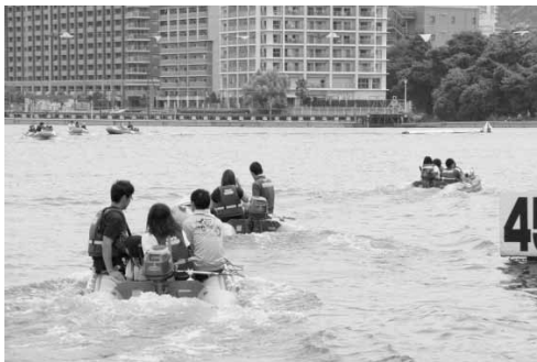
ファミリーカーニバル 平成28年7月24日（日）