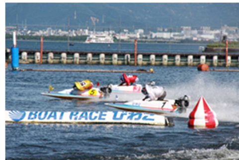
迫力のボートレース