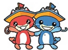
マスコットキャラクター 「ピナスちゃん」「ピナちゃん」

また、びわこボートレース場では競艇事業以外に、ファミリーカーニバルの開催や、スモールドラゴンボート日本選手権大会の会場として施設を開放するなど、施設の紹介や競艇事業のPRに努めています。