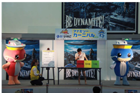
ファミリーカーニバル 平成27年7月26日（日）