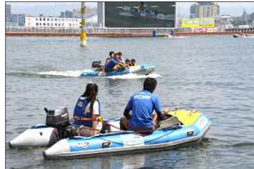
ファミリーカーニバル (平成25年8月4日(日))