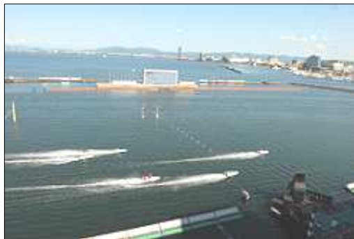
絶好のロケーションで迫力のボートレース