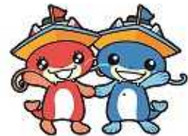
マスコットキャラクター 「ピナスちゃん」「ピナちゃん」

また、びわこボートレース場では競艇事業以外に、ファミリーカーニバルの開催など、施設の紹介や競艇事業のPRに努めています。