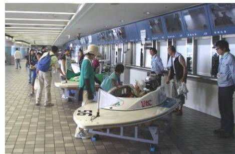
ファミリーカーニバル 平成23年7月31日(日)