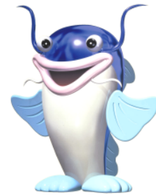
マスコットキャラクター 「ピナちゃん」

また、びわこボートレース場では競艇事業以外に、ファミリーカーニバルの開催や、刑務所矯正展の会場として施設を提供するなど、施設の紹介や競艇事業のPRに努めています。