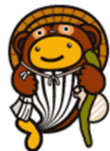
信楽焼たぬきクーちゃん

そうしたお金が道路や橋、学校、公園の整備など県内の公共事業に使われて、みんなの豊かな生活のためにたいへん役立っているんだ。