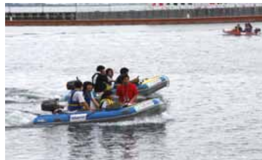
ファミリーカーニバル 平成22年8月8日(日)