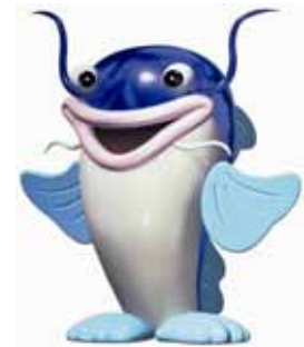
マスコットキャラクター 「ピナちゃん」

また、びわこボートレース場では競艇事業以外に、ファミリーカーニバルの開催や、びわ湖ドラゴンボートスプリント選手権大会の会場として施設を開放するなど、施設の紹介や競艇事業のPRに努めています。