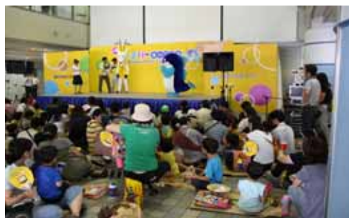
ファミリーカーニバル 平成22年8月8日(日)