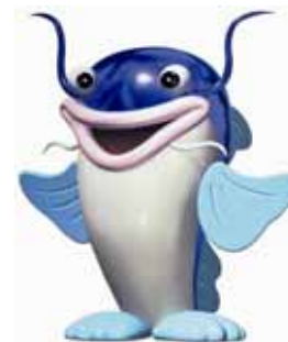
マスコットキャラクター 「ピナちゃん」

また、びわこボートレース場では競艇事業以外に、ファミリーカーニバルの開催や、びわ湖ドラゴンボートスプリント選手権大会の会場として施設を開放するなど、施設の紹介や競艇事業のPRに努めています。