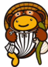
信楽焼たぬきクーちゃん (滋賀県のご当地クーちゃん)

なぜ県内で買って欲しいのかって？それは、滋賀県内で売れた宝くじの収益金は、滋賀県の収入になるからだよ。そうしたお金が道路や橋、学校、公園の整備など県内の公共事業に使われているからさ。みんなの豊かな生活のためにたいへん役立っているのです。