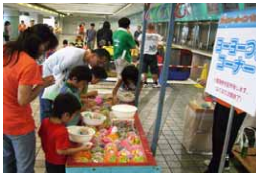
ファミリーカーニバル 平成21年8月9日(日)