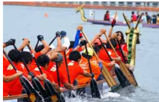
びわ湖ドラゴンボートスプリント選手権大会 平成21年9月12日(土)