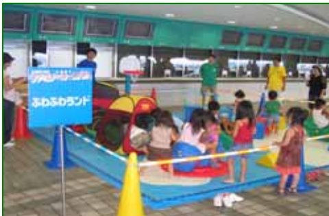
ファミリーカーニバル 平成19年8月11日(土)