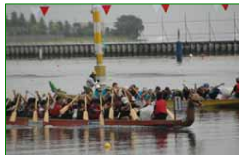
びわこドラゴンボート選手権大会 平成19年9月30日(日)