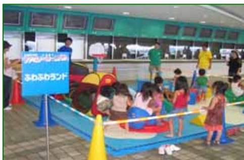
ファミリーカーニバル 平成19年8月11日(土)