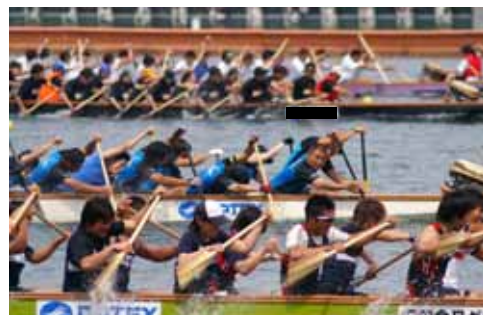
びわ湖ドラゴンボートスプリント選手権大会 平成18年6月4日(日)