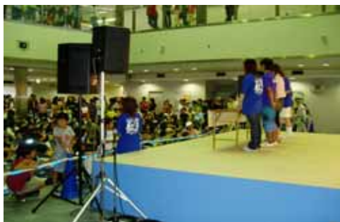
ファミリーカーニバル 平成18年7月23日(日)