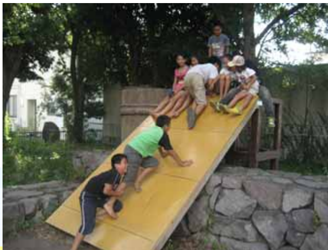
冒険遊び場「けがと弁当は自分もち」