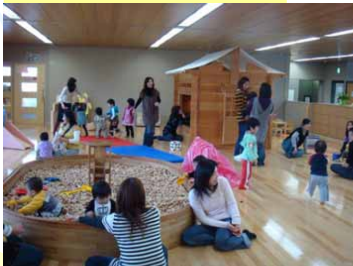
親子サロン「親子がほっこり」