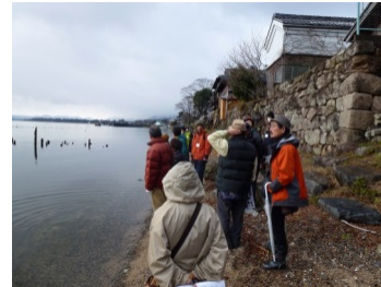
観光資源の磨き上げ (ガイド人材育成等)