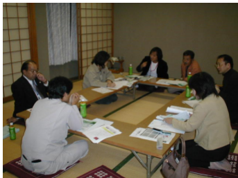
観光まちづくりに向けた合意形成