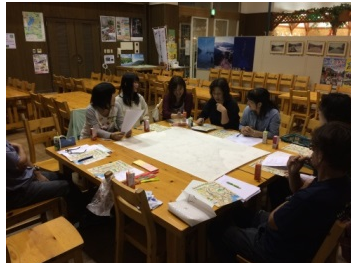
ワークショップ開催 (マーケティング等検討)