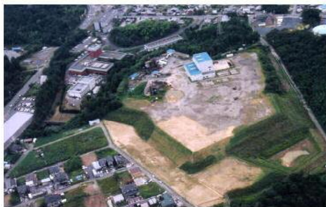
(株) アール・ディエンジニアリング (平成17年航空写真)