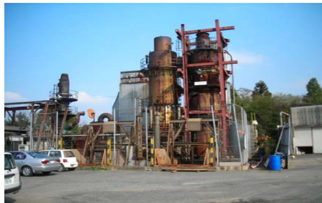
写真 1.3 南側焼却炉