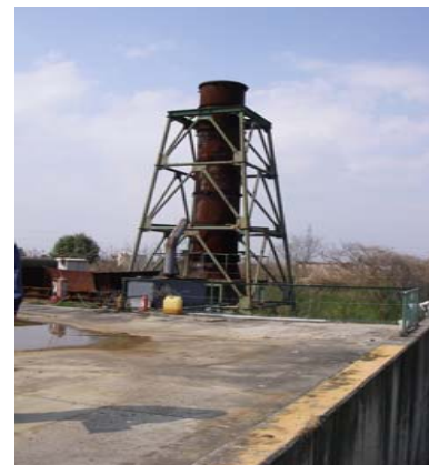
写真 1.4 東側焼却炉