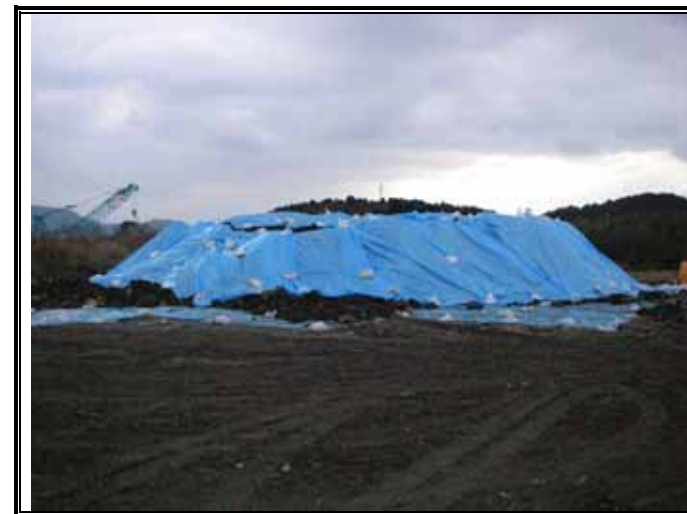
仮置きヤードのシート養生