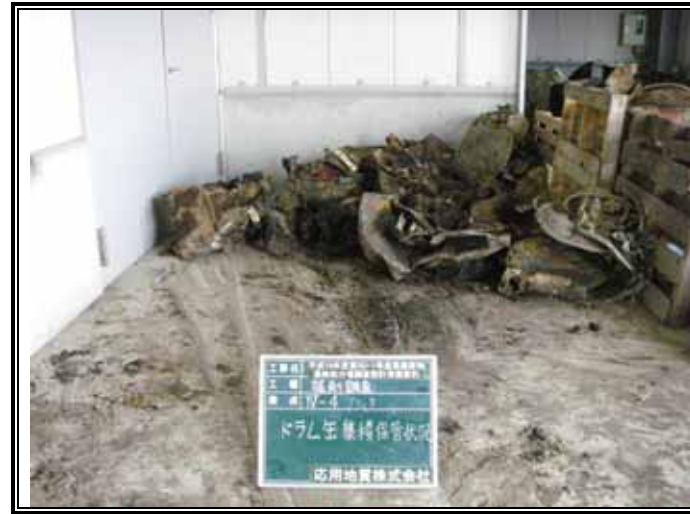
ドラム缶 集積保管状況