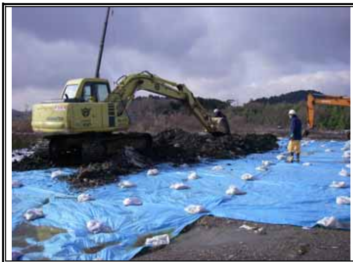
仮置きヤードの全景