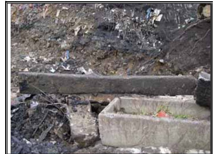
コンクリートの枕木