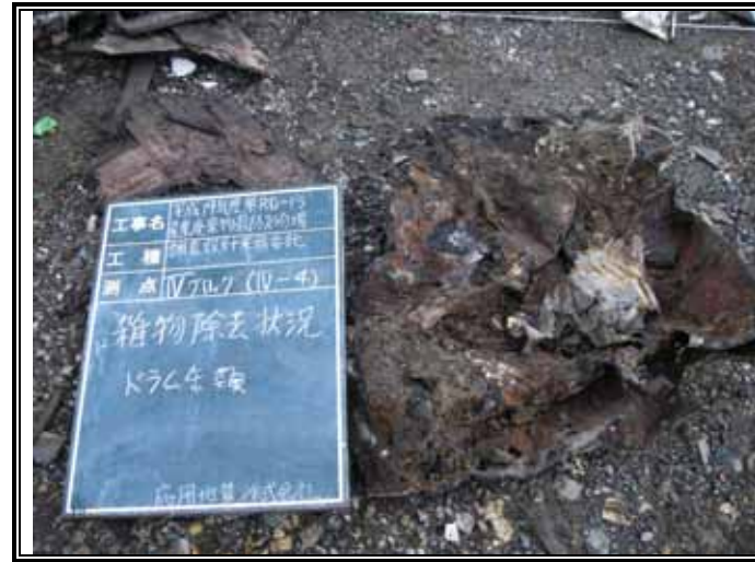
雑物除去 つぶれたドラム缶類