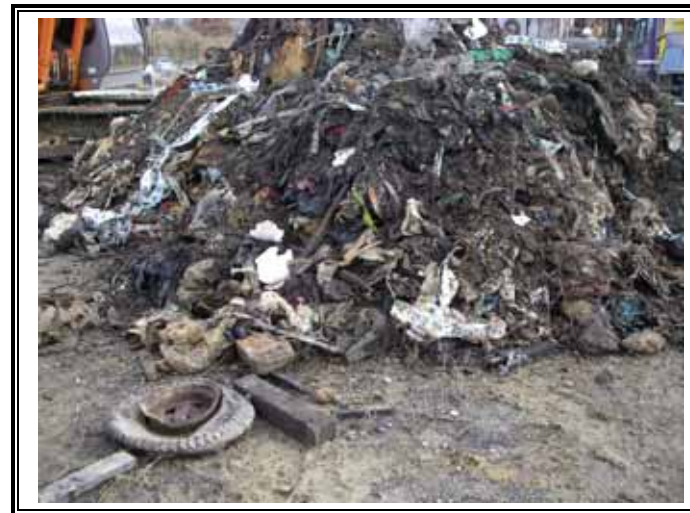
掘削した廃棄物の仮置き状況