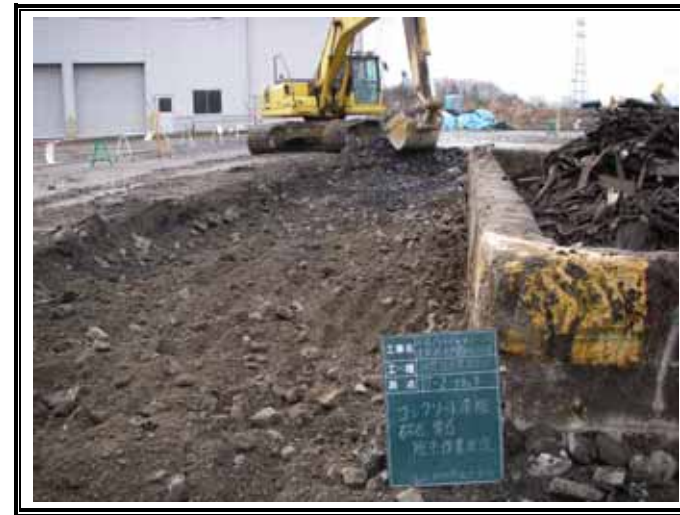
コンクリート 砕石・栗石撤去状況