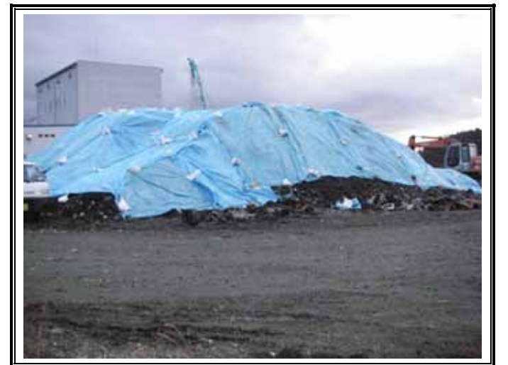
仮置きヤードのシート養生