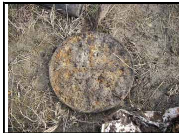
マンホールのふた