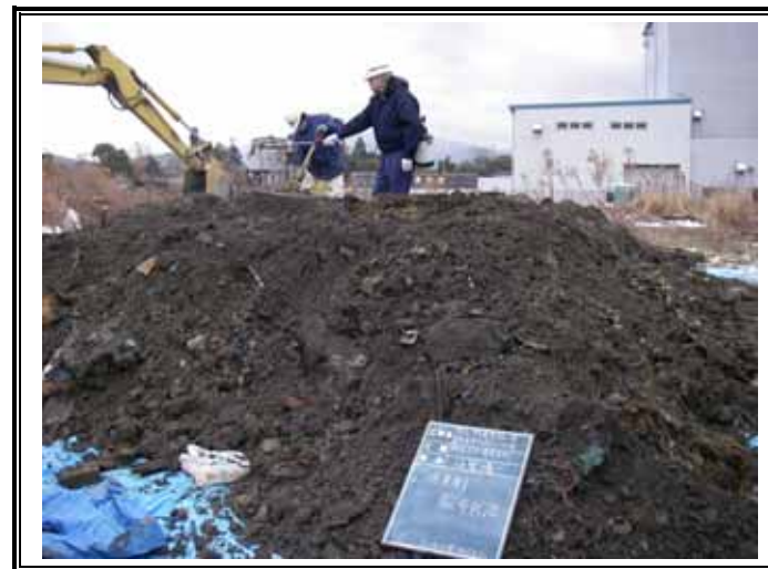
仮置きヤードにおける成形