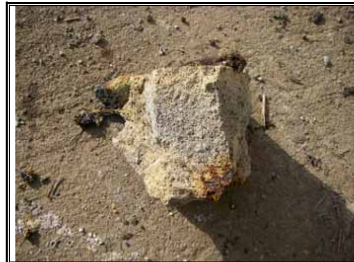
雑物除去 発泡モルタル