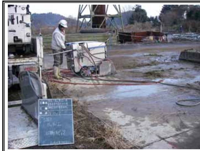
コンクリートカッター入れ