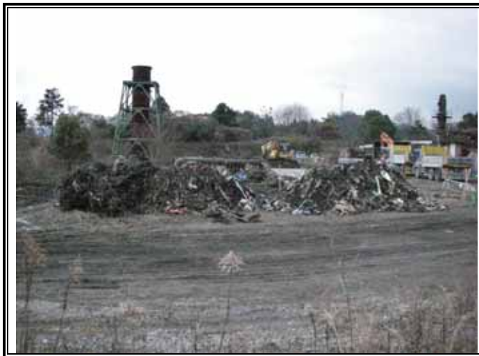
掘削残土の仮置き状況