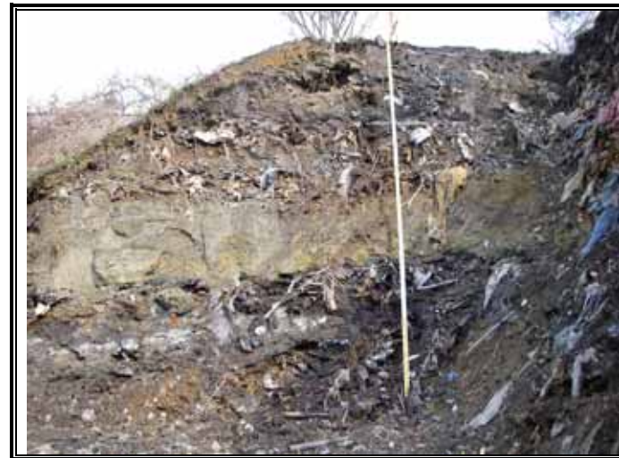
埋め立て廃棄物の状況（医療系廃棄物）