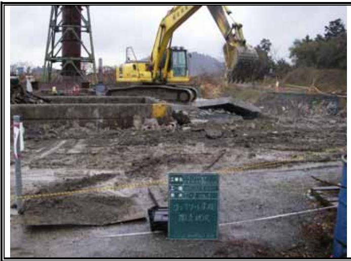
コンクリート床板 撤去状況