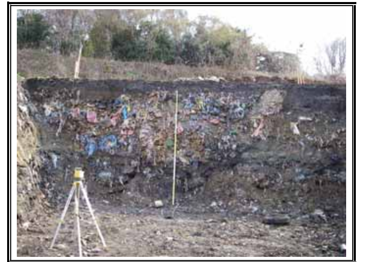
埋め立て廃棄物の状況（医療系廃棄物）