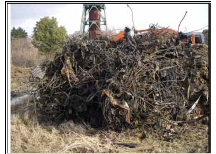
掘り出された鉄筋塊