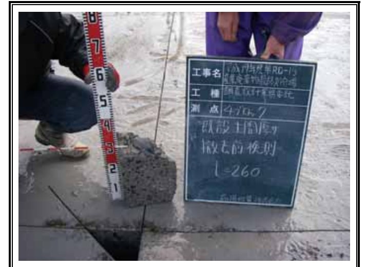
コンクリート厚 t = 260mm