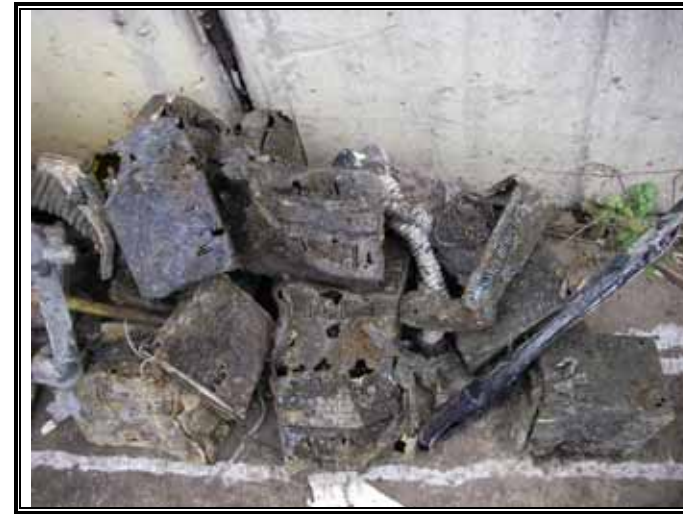
雑物除去 廃モータ類