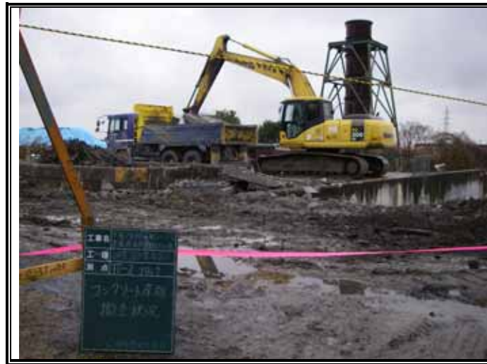
コンクリート床板 撤去状況