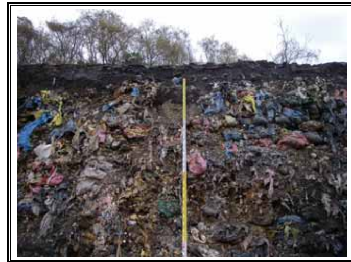
埋め立て廃棄物の状況（医療系廃棄物）