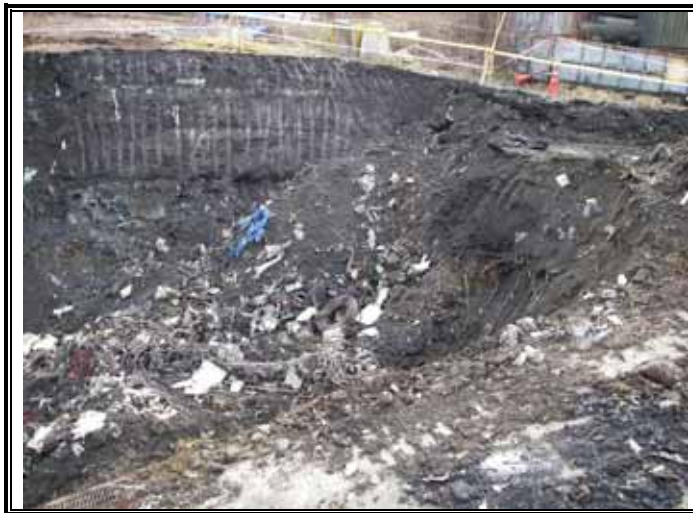
埋め立て廃棄物の状況