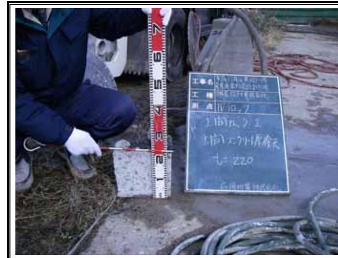
コンクリート厚 t = 220mm