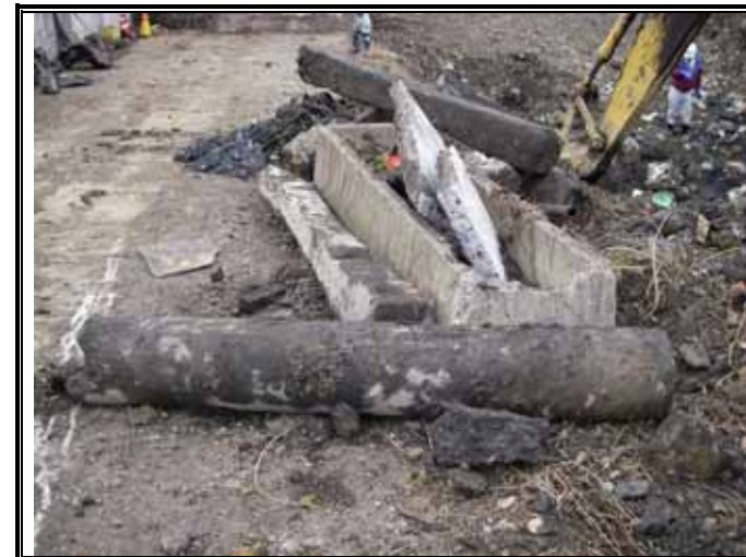
雑物除去 コンクリートがら