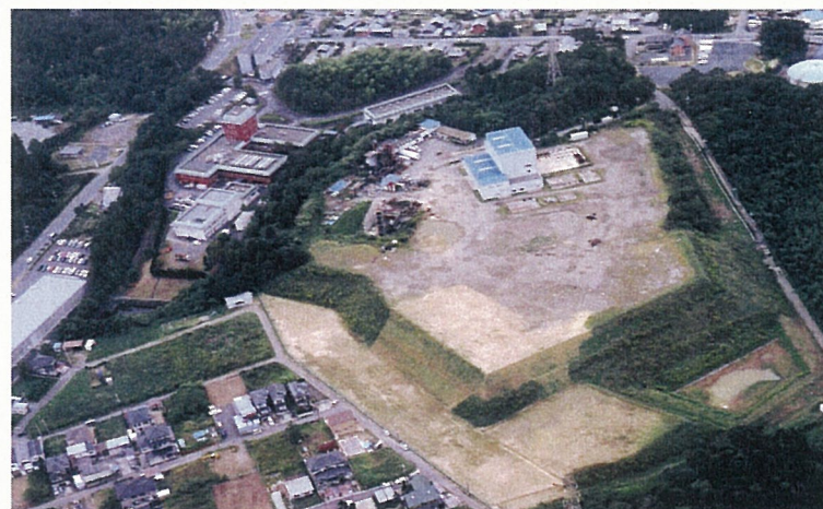
（株）アール・ディエンジニアリング（平成17年航空写真）