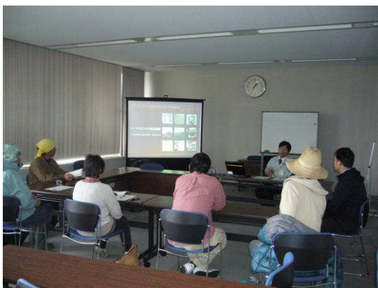
マーケティング・商品展開研修風景

今後は、受講生自身が経営概要を説明する相互現地研修を予定しており、受講生の経営状況把握や経営改善につなげたいと考えています。