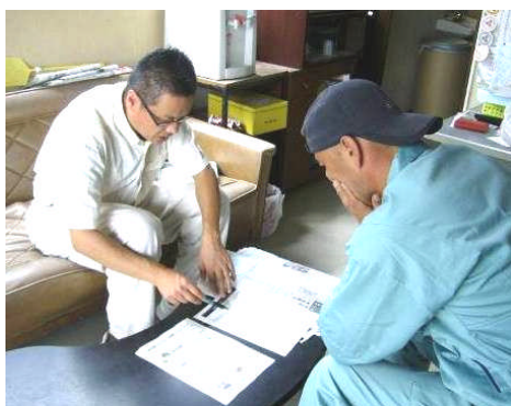
(写真1) 事業進捗状況の聞き取りとフォローアップシートの説明

今後、当課では、各経営体に対して6次産業化プランナーを活用した商品開発の実践、行政分野と連携した販路拡大の取組への支援を行っていきます。