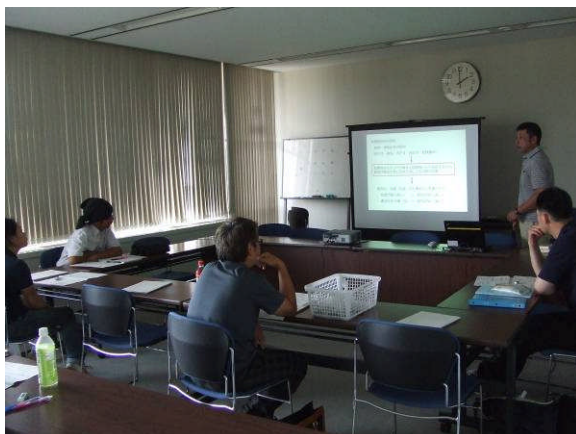
肥料の基礎知識についての講義

今後は、現地研修やマーケティングなどの研修を予定しており、受講生の基礎技術の習得や仲間づくりにつなげたいと考えています。