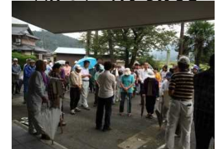
平成27年9月避難訓練