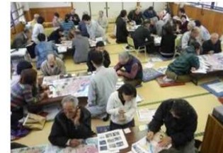
平成24年11月図上訓練