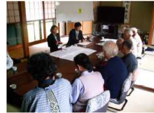
平成22年10月水害体験等聞き取り