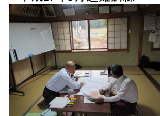
平成28年12月 個別説明会