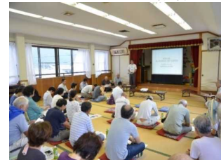
平成28年9月 浸水警戒区域に関する説明会