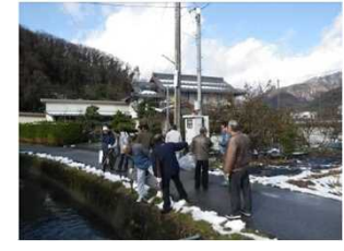
平成23年12月まちあるき