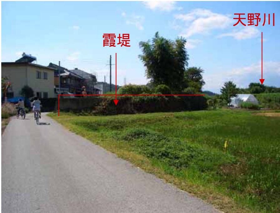
場所:天野川左岸 寺倉 / 撮影日:2009年9月13日