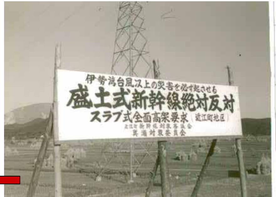
箕浦地域などが、盛土式新幹線を反対。