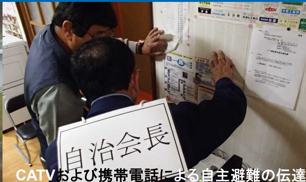
CATVおよび携帯電話による自主避難の伝達