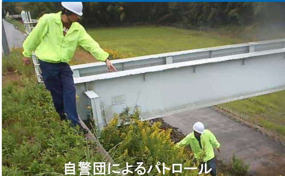
自警団によるパトロール