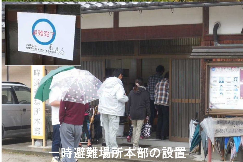
一時避難場所本部の設置