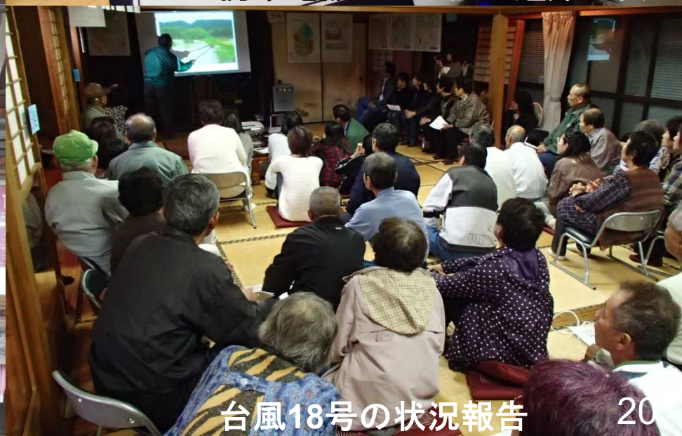
台風18号の状況報告