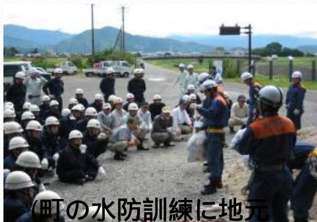
(町の水防訓練に地元 自主防災組織も参加)