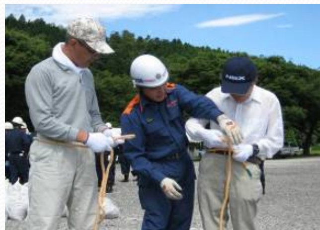
(もやい結びの練習)