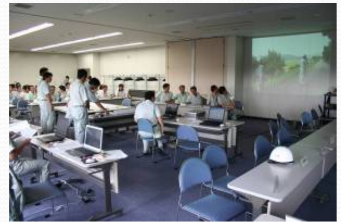
平成20年度防災訓練