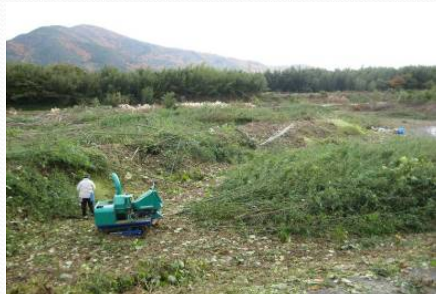
(作業後 「太閤堤が出現」)