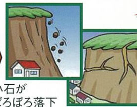
小石が ぼろぼろ落下