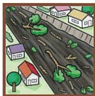
流木発生・溪流内の転石の音