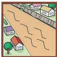
流水の異常な濁り