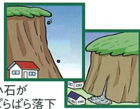
小石が ばらばら落下