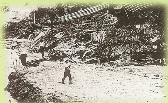
写真1 土石流で倒壊した家屋 (S28 甲賀市信楽町多羅尾) — 死者行方不明者44名 —