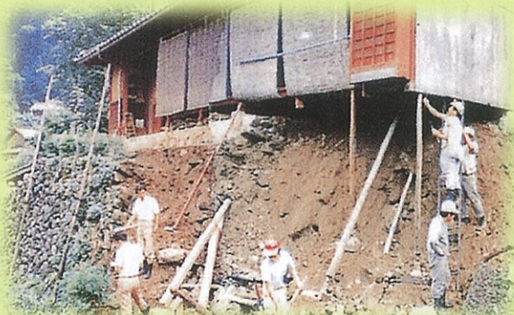
写真2 かけ崩れで土台を失った家屋(S57 多賀町入谷)