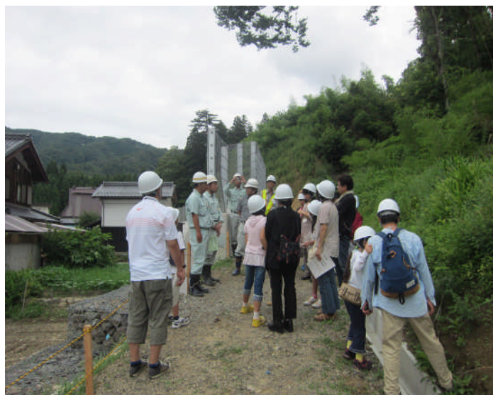
急傾斜地崩壊対策工事（西浅井町集福寺）

平成23年7月22日（金）に、現地での体験学習をとおして土砂災害防止に関する知識を身につけてもらうことを目的として親子さぼう学習会が開催されました。