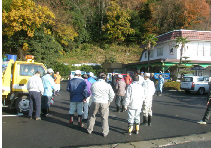
作業前の安全確認

葛箆尾崎大浦線（通称：奥琵琶湖パークウェイ）の桜並木に「てんぐす病」の被害が目立ち観光客や地元関係者から心配の声が上がっていました。このため昨年度に第1回目の撤去作業を行いました。引き続き今年度も（平成23年12月13日）地元関係者・ボランティアの皆様・長浜市役所西浅井支所と当所が一緒になって合同作業を行いました。桜の本数も多いため、今後も引き続き、このような協働作業を実施し桜並木の景観を残していきたいと思っておりますのでご協力をお願いします。