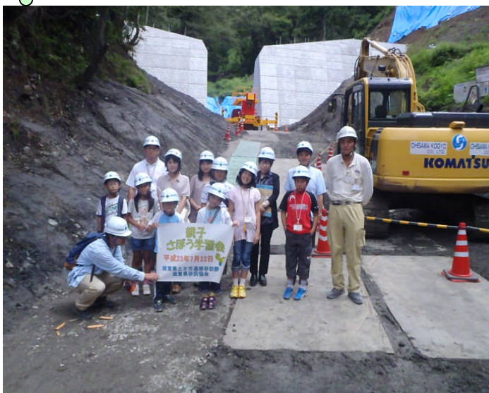
宮の谷川砂防工事（余呉町東野）