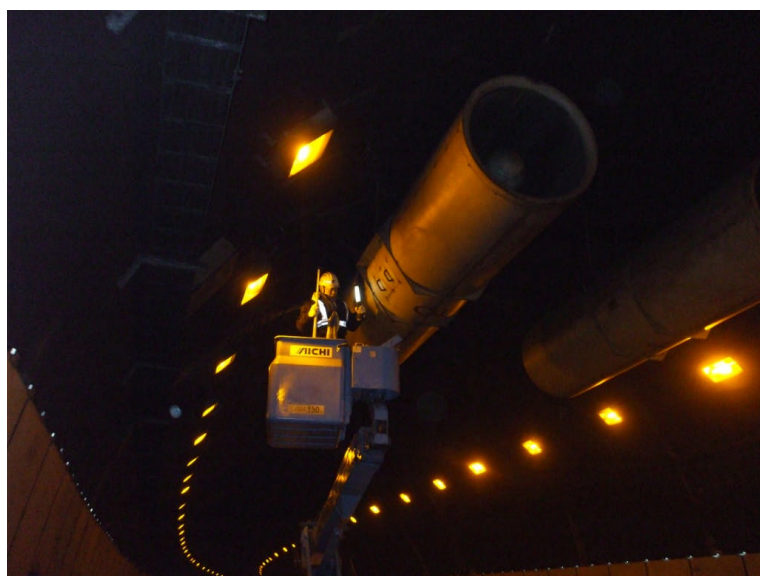
奥琵琶トンネル点検の様子

点検方法は、対象トンネル14箇所、ジェットファン・照明灯などについて高所作業車での目視及び打音、触診による点検を行いました。点検結果は、照明灯について、ボルト・灯具等に腐食等が確認され、落下の恐れがある灯具については、撤去しました。