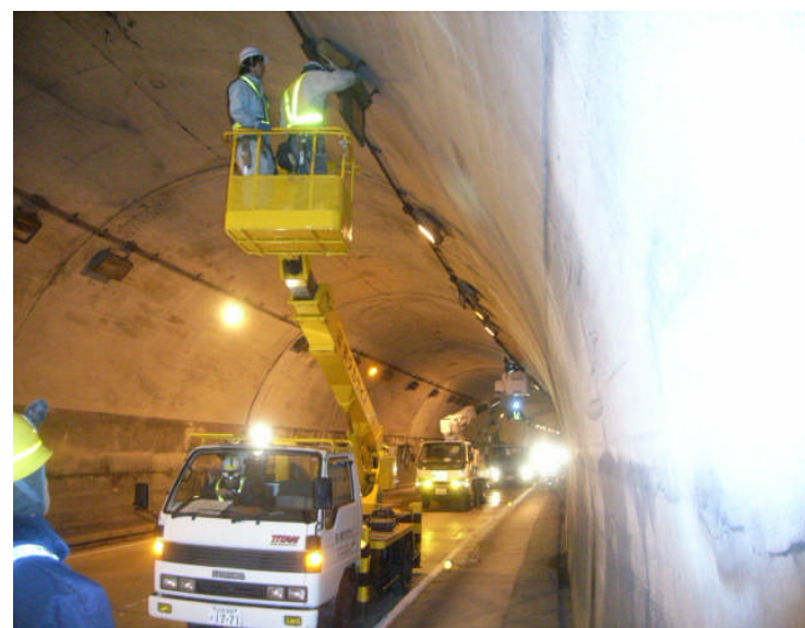
片山トンネル点検の様子