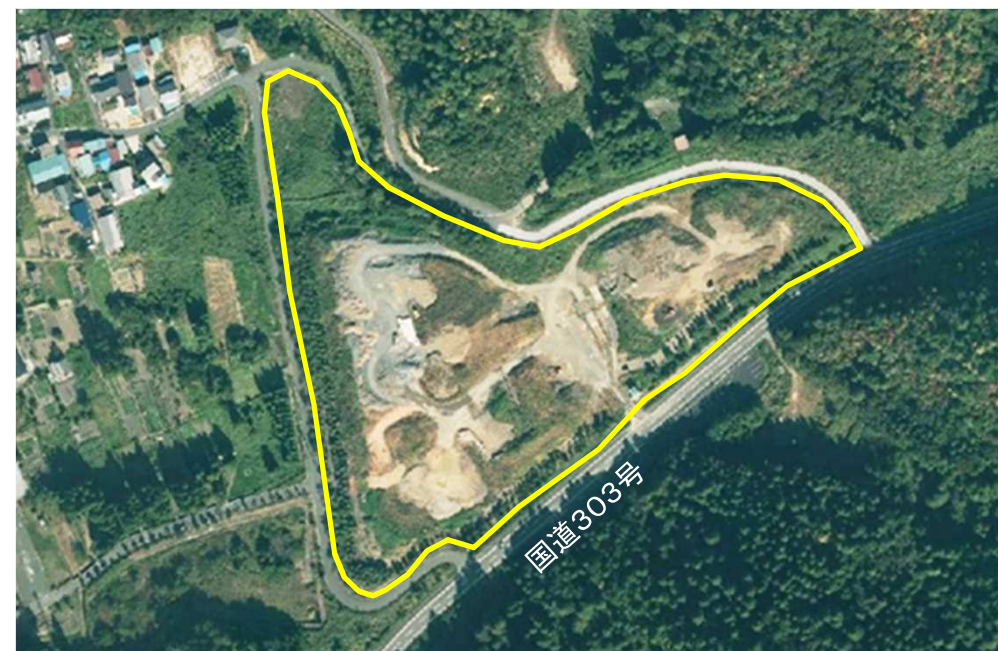
滋賀県長浜土木事務所木之本支所

連絡先 滋賀県長浜土木事務所 木之本支所 管理課 TEL 0749-82-3705 FAX 0749-82-2654 mail ha36100@pref.shiga.lg.jp