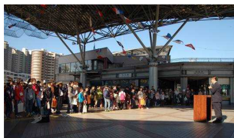
乗船にあたっての注意事項を聞く