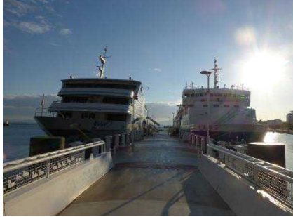
同じ桟橋に並んで子どもたちの乗船を待つピアンカ(左)とうみのこ(右)