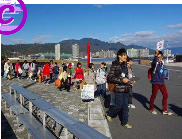
Cグループ乗船開始