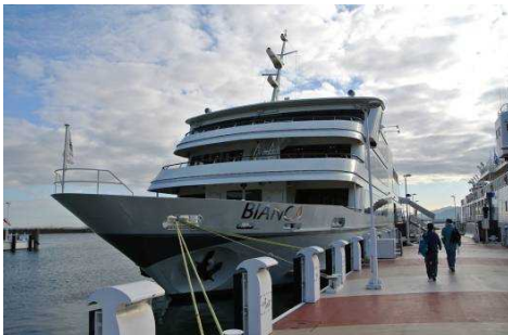
大型客船「ピアンカ」