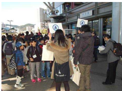
参加者は、各グループのプラカードを掲げたスタッフのところに集まって整列しました