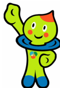
滋賀県マスコット うおーたん