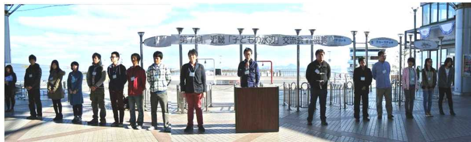
小林リーダーからの進行説明のあと、若手実行委員が前に並び一礼 当日の進行役であるファシリテーター・コーディネーターを務める