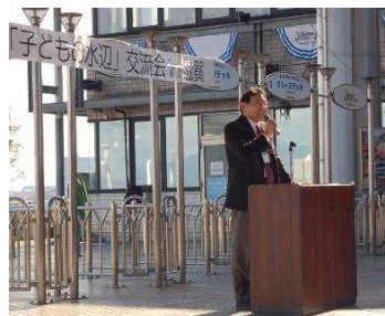
宮嶋会長から開会宣言