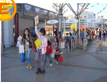
Eグループ乗船開始