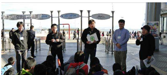
Dグループを担当したスタッフ