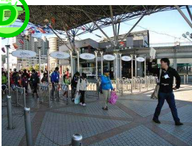
Dグループ乗船開始