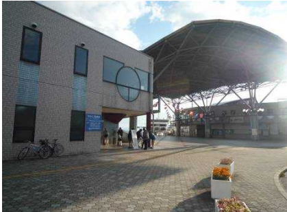
早朝の大津港ターミナル