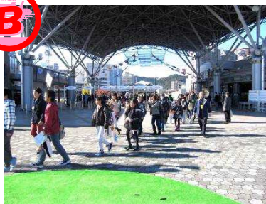
Bグループ乗船開始