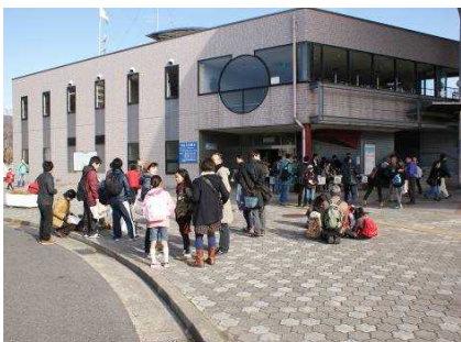
近畿各地から徐々に参加者が集まってきました