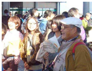
Eグループを担当したスタッフ