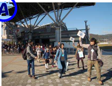
Aグループ乗船開始