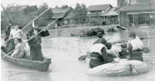
(写真)彦根地方気象台