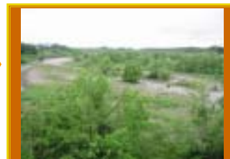
犬上川の 雑木繁茂 状況

事業名：芹川・犬上川河道内雑木伐採業務委託 場所：芹川（彦根市大堀町～多賀町八重練） 犬上川（甲良町小川原～多賀町敏満寺） 内容：河道内雑木伐採（芹川 250 本・犬上川 980 本）