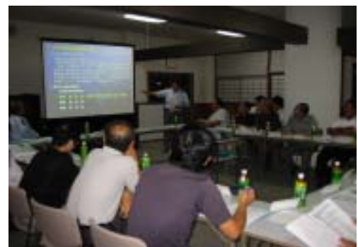
第1回協議会の様子

そこで、湖東地域振興局では都市計画道路の事業化を進めるため、『長曽根銀座河原線整備検討協議会（以下、協議会）』を立ち上げ、9月15日に第1回目の協議会を開催しました。住民参画型のこの協議会では、ワークショップやアンケートなどで広く住民の意見を聞き、地域の合意形成を図りながら、最も望ましい道路の線形や幅員構成などを決定します。その際、30年以上前に決定された道路計画が、現在の交通事情や住民ニーズに合致したものかも改めて検討する予定です。