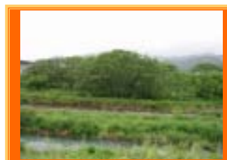
芹川の 雑木繁茂 状況

事業名：百済寺甲上岸本線、多賀永源寺線側溝清掃業務委託 場所：愛東町百済寺甲、多賀町川相他 内容：側溝清掃 3.7 Km