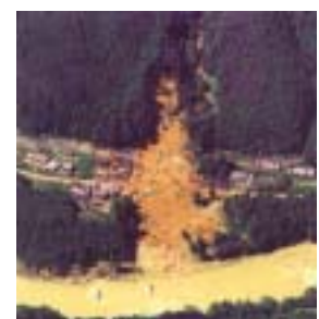
台風21号の集中豪雨による被害状況(三重県宮川村)