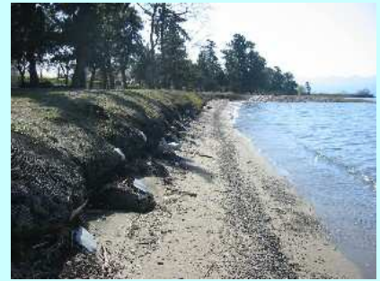
袋詰玉石による浜崖応急処置