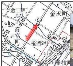
大津能登川長浜線

平成15年から進めてきました彦根市稲部町地先の歩道設置工事が完了しました。この箇所は、交通量の多い主要地方道ですので、歩道の設置により人と車が安全に通行できるようになりました。