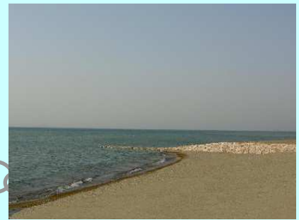
工事完成イメージ

新海浜水泳場一帯は、 平成17年11月30日まで（予定） ご利用頂けません。ご理解とご協力をお願いします。