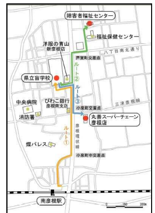
実験エリアとルート