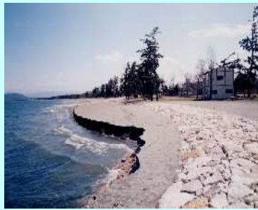
↓平成7年 浜崖の様子