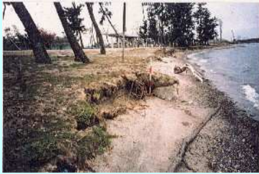
↑平成5年 浜崖の様子

浸食対策工事は、背後地を保護するとともに、湖辺の利用や景観との調和に配慮した浜辺つくりを目的に実施しています。