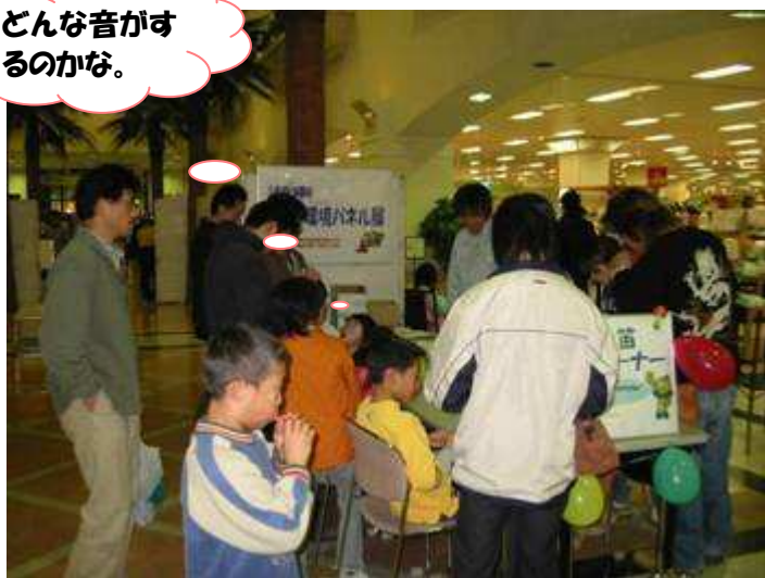
ヨシ笛体験コーナー

ヨシ笛づくりは大好評で、1日100個用意していたヨシ笛作成キットが、連日閉場3時間前にはなくなる程でした。