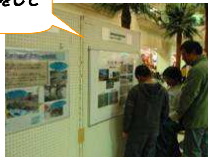
パネルを見る親子