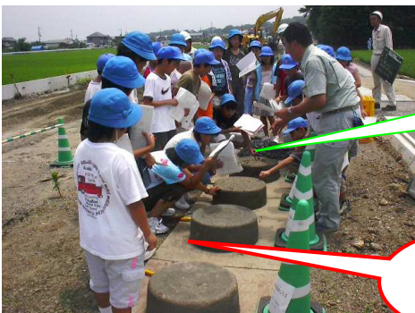
土に触れてみよう