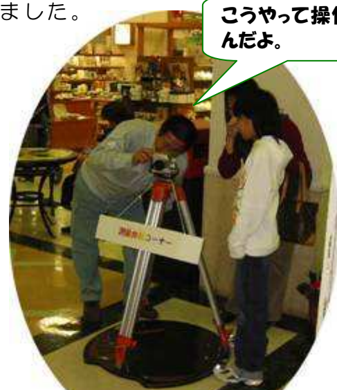
測量体験コーナー (レベル)

測量機材に初めて触る人が殆どで、初めて覗く世界にびっくりされていました。また、「道端で何をされているのか分かりました！」と日常の疑問が解決したとの声をたくさん聞けました。