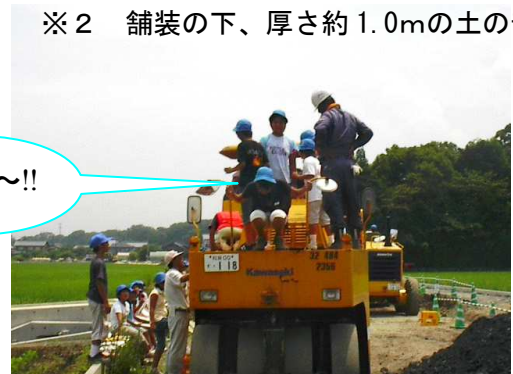
建設機械に乗ってみよう