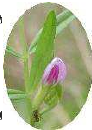
カラスノエンドウ

そこで、湖東建設管理部では、河畔林に繁茂する竹木をチップにし、防草対策等のマルチング効果を検証する実験を始めました。この実験は3年間の計画で、効果が確認できれば、道路敷の植栽帯や路肩等の雑草抑制材としての利用を検討していきます。