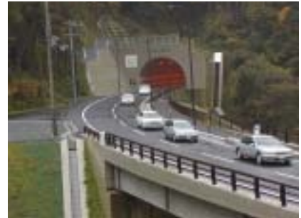
国道303号 (木之本町金居原、1,713m) 平成14年11月12日開通！