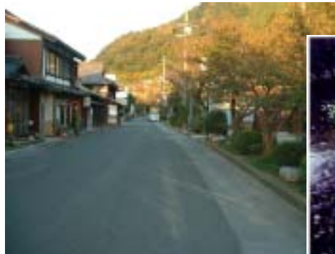
(写真上「醒井宿」右「梅花藻」)

中山道六十二番目の宿、番場。長谷川伸の名作「臉の母」の主人公番場忠太郎の故郷であり、宿場の中ほどにある蓮華寺は、聖徳太子が建立したと伝えられています。「番場宿」から名神高速道路に沿って歩くこと約1時間、中山道第六十一番目の宿場町「醒井宿」は、現在でもJR東海道本線、旧中山道、国道21号線、名神高速道路が併走する