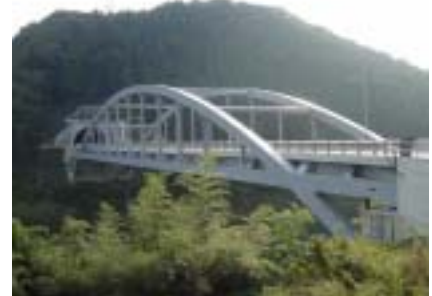
大津市道幹2028号 (大津市曾束町～石山外畑町、1,800m) 平成14年10月20日開通！ (道路建設担当)