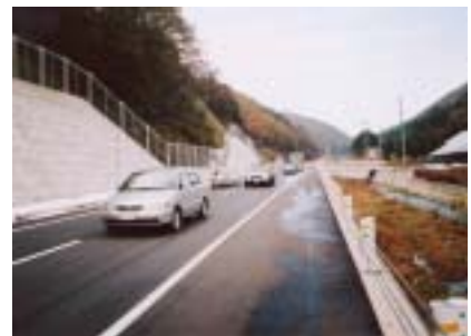
国道365号 (余呉町中河内、780m) 平成14年11月13日開通！