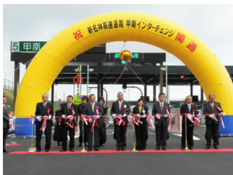
3月20日に行われた開通式