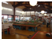
生産品販売コーナー