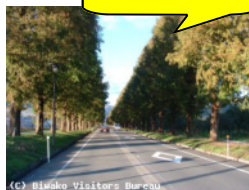
メタセコイヤ並木

マキノ町沢では、県道小荒路牧野沢線のバイパスが完成し、国道161号から美しいメタセコイヤ並木の道路まで快適に走れるようになりました。