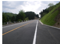
国道421号(黄和田工区)不老橋の工事状況

高島市今津町途中谷の国道367号はカーブの多い危険な道路でしたが、バイパスが完成し走りやすい道路になりました。