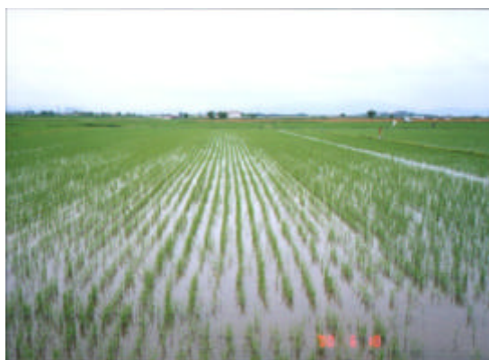
写真 - 25 播種後30日後のほ場の状態