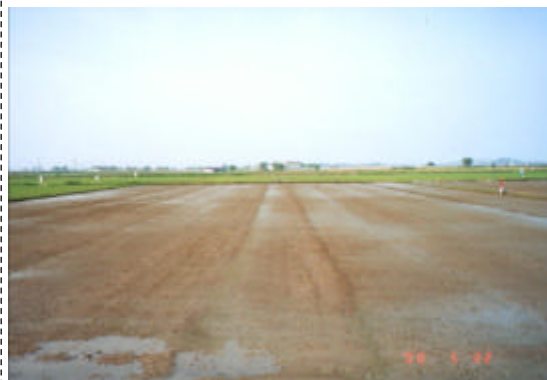
写真 - 24 播種後の無湛水状態