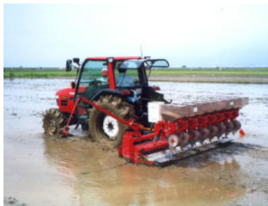
写真 - 23 代かき同時播種作業の風景

慣行のすじ播き機による湛水直播栽培は、代かき数日後に播種するが、「代かき同時播種機」は仕上げ代かきと播種が同時であるため、代かき前後の水管理が慣行の湛水直播栽培に比べて容易なことがポイントである。