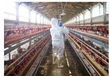
鶏舎のサルモネラ浸潤調査