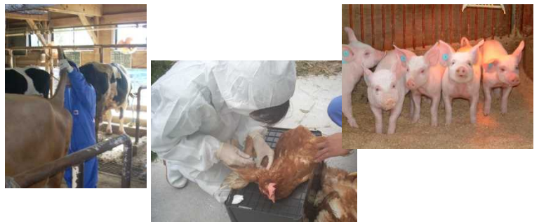
定期検査のための農家巡回における採血