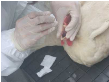
高病原性鳥インフルエンザのモニタリング