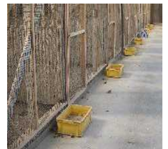
(踏み込み消毒槽の設置)