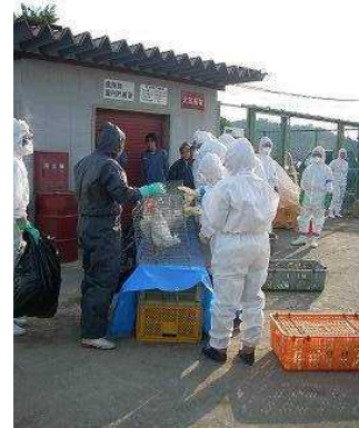
防疫演習 (口蹄疫・高病原性鳥インフルエンザ対応)