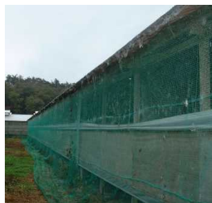
(防鳥ネットの設置)