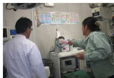
飼育動物診療施設の立入検査