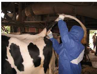
牛の慢性疾病検査