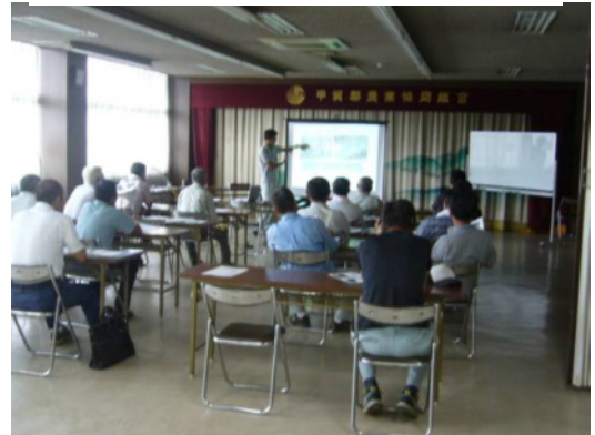
人・農地プラン説明会の様子

甲賀市土山町では、茶価の低迷によって茶業経営が厳しくなる中、担い手の兼業化や高齢化もあいまって、製茶工場の操業を停止したり、経営規模を縮小する農家が増加しています。一方、認定農業者を中心とした担い手はすでに限界近くまで規模経営拡大を行っており、受け手が見つからない茶園が増加することで、耕作放棄地の増加が懸念されています。今後、産地の維持・存続には、地域の茶園の有効利用や担い手への集積が必要であり、耕作放棄地の状況などを地域の茶業者が共有し、産地全体としての土地利用に関する将来ビジョン（人・農地プラン）の策定が急務となっています。そこで、24年度は、前年度から行っている茶園情報マップの内容を見直すとともに、新たに土山町茶業協会に働きかけて、人・農地プランの作成を支援しました。