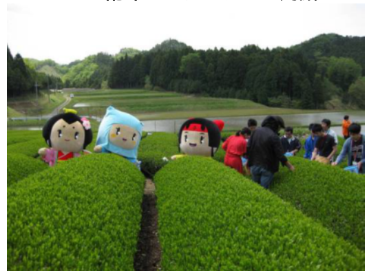
守ろう、美しい土山の茶園

今後、土山町茶業協会の活動を引き続き支援し、アンケートの集計作業、資料のとりまとめ、将来マップの検討等を順次行い、人・農地プランの策定を目指します。