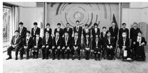
▲2月7日 表彰式 (県公館)

本年度は、電子機器組立、ホームページ、喫茶サービスなど11競技種目に97名の選手が出場して、日頃職場や職業訓練の場で培った技を競いました。成績優秀者には、滋賀県知事より滋賀県知事表彰が、滋賀障害者職業センター所長から金賞、銀賞、銅賞、努力賞が授与されました。