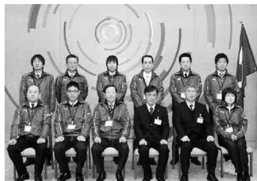
<敬称略> ▲2月6日 結団式 (県公館)