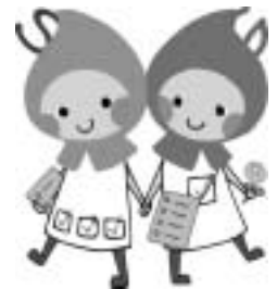
滋賀県健康づくりキャラクター 「しがのハグ&クミ」